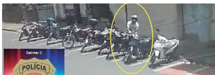
Crime solucionado - Polícia Civil encontra suspeito de furto de motocicleta, ocorrido no Centro, em 5 de março. Ele responderá a inquérito policial e segue à disposição da Justiça.

O suspeito responderá a inquérito policial por furto e segue à disposição da Justiça. A Polícia Civil reforça a importância das denúncias anônimas, que podem ser feitas pelo telefone 181, para o