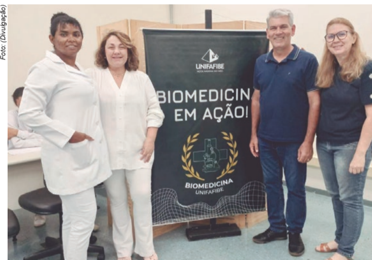
Cuidado com a saúde - Profissionais e estudantes realizam testes gratuitos e orientam população da importância da prevenção de doenças renais.