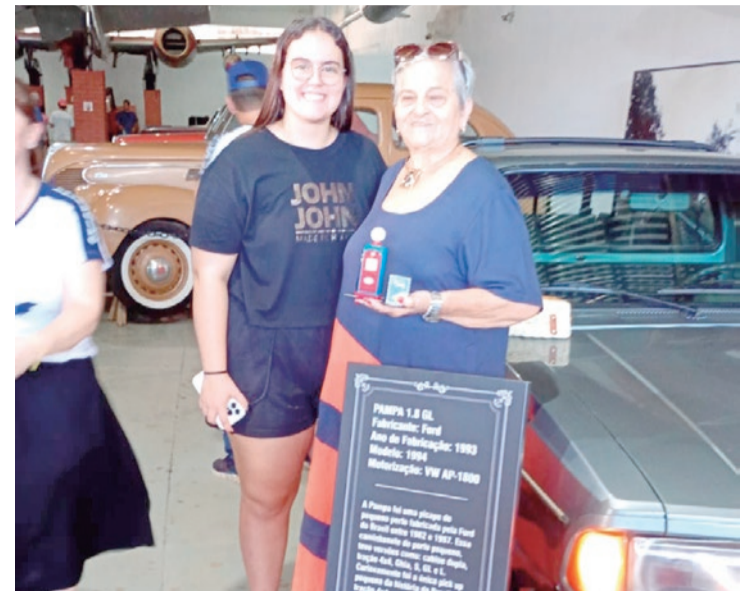
Legado sobre rodas – A doação da Ford Pampa 1.8 GL ao Clube Esplendor reforça o compromisso com a preservação da história automobilística.

também contou com a Feira de Artesanato, realizada na Praça Carlos Gomes, em frente ao museu, no domingo (30), das 10h às 15h, que agradou aos visitantes e proporcionou experiência mais completa e cultural.