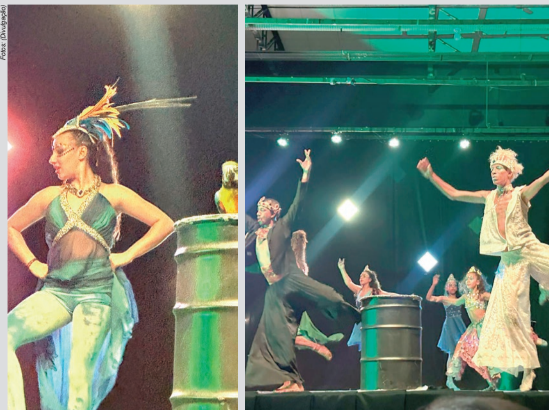
Arte - Cia de Dança Desiderata apresenta espetáculo 'Quatro Estações', no palco do Teatro, com casa cheia.

Todos os 560 lugares do Teatro Municipal ocupados em noite emocionante, diz coordenadora do projeto.