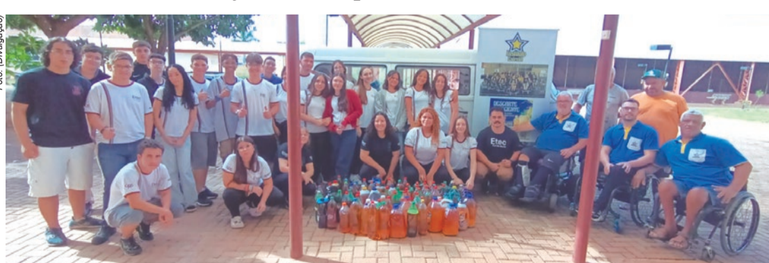
Trote Solidário - Alunos da Etec de Bebedouro promovem ação e arrecadam 200 litros de óleo de cozinha usado para Instituto Estrela.