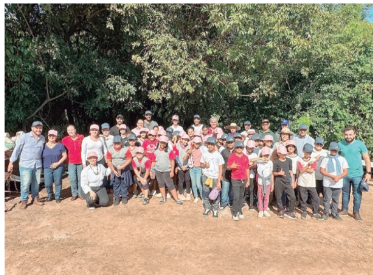
Semeando o futuro – Crianças e jovens participam do plantio de mudas nativas, contribuindo para recuperação de nascentes e conservação ambiental.

Atividades educativas e ambientais reforçam a importância da preservação dos recursos hídricos e do meio ambiente.