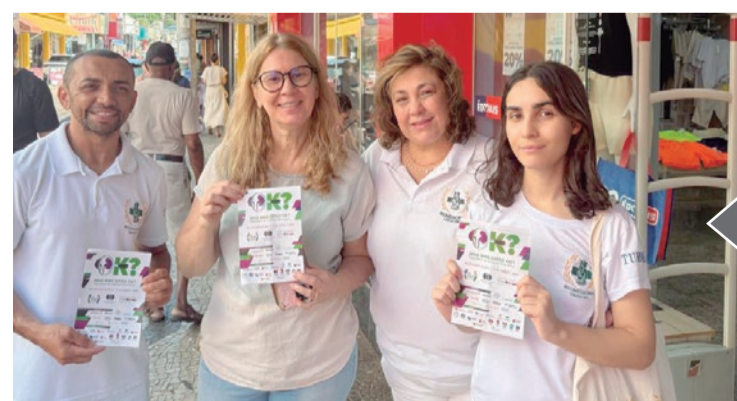
Campanha - "Seus Rins Estão OK?" leva informações aos frequentadores do centro comercial de Bebedouro, com orientações sobre hidratação, exames regulares e hábitos saudáveis.

futura. O prefeito Lucas Seren também enfatizou o compromisso da gestão municipal com o desenvolvimento sustentável e a valorização das iniciativas ambientais na cidade. Pág. 4