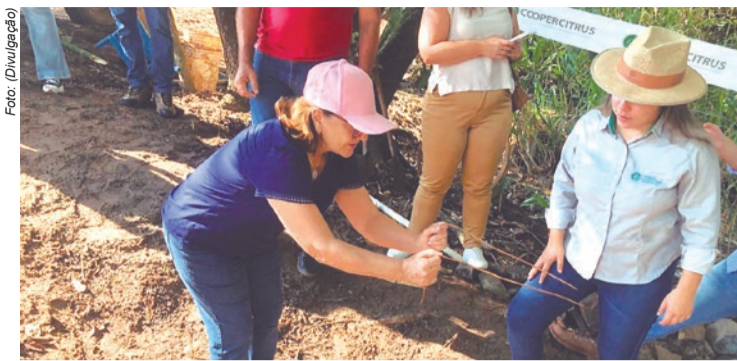
Mãos na massa - Participantes realizam o plantio de mudas nativas durante a caminhada ecológica, reforçando o compromisso com a preservação das nascentes e a sustentabilidade ambiental.

A programação incluiu exposição interativa sobre o ciclo da água, destacando desde sua origem nas nascentes até seu uso doméstico, industrial e na geração de energia. "Alunos e participantes vivenciaram caminhada ecológica guiada, proporcionando maior interação com a natureza e reflexão sobre a importância dos recursos hídricos", descreve